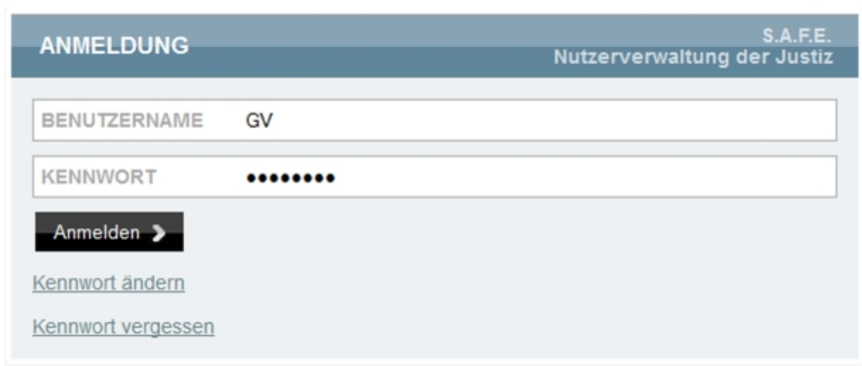
Anmeldung im Vollstreckungsportal

Für die manuelle Recherche ist eine Registrierung für den Zugang zum Vollstreckungsportal erforderlich.